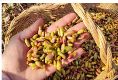
RÉCOLTE DES BOURGEONS

Nous pouvons ainsi éviter des transports sur de longues distances.