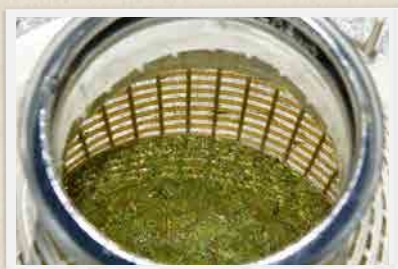
EXTRACTION PENDANT 3 MOIS