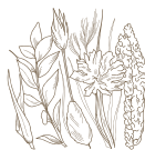
Fleurs de foin